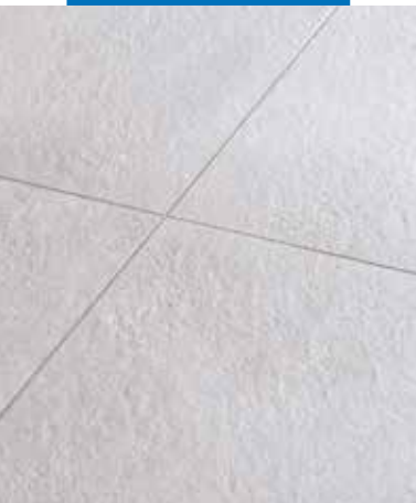
Pavimentazione stuccata con Keracolor GG