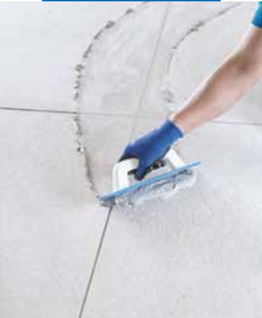
Stesura di Keracolor GG con spatola MAPEI