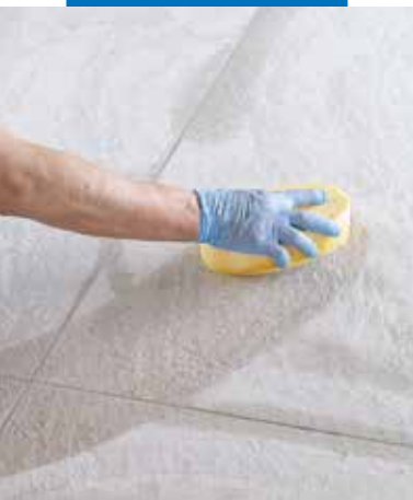
Pulizia e finitura delle fughe con spugna di cellulosa dura